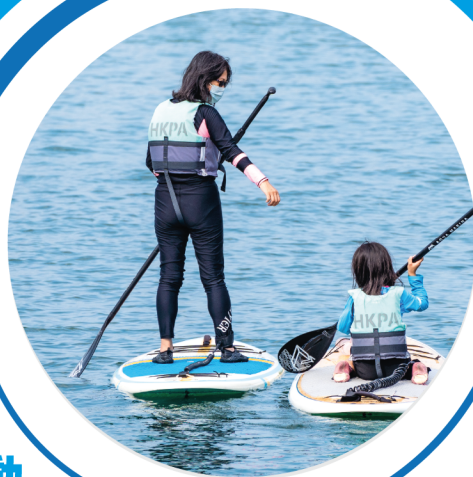
親子水上活動 工作坊